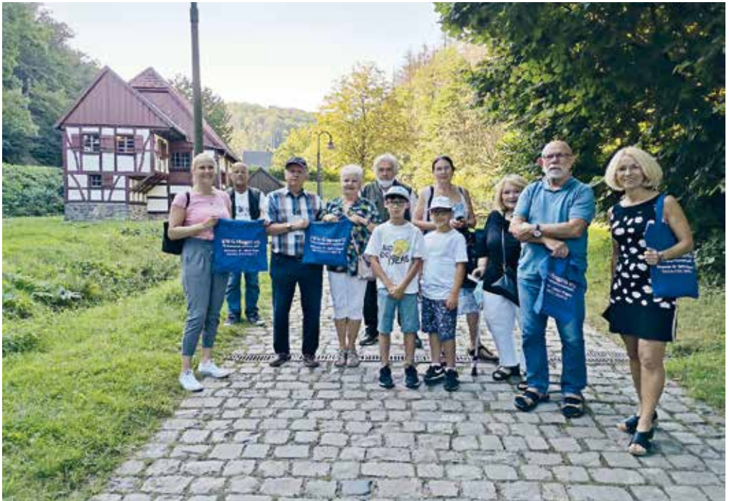
Unsere Ausflügler im Freilichtmuseum